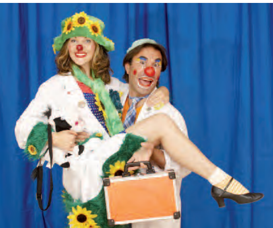
Besuchen seit September 2009 die Senioren in Stockstadt – Dr. Schnickschnack und Dr. Pille-Palle.

Wie wertvoll die Clowndoktorenarbeit für Kinder im Krankenhaus ist, beobachtet das Team des CLOWN DOKTOREN E.V. seit 15 Jahren in der eigenen Arbeit. In den letzten Jahren wurde der Verein zunehmend gefragt: „Können Sie nicht auch Clowndoktoren in Seniorenheimen einsetzen?“ Erfahrungen in der Arbeit mit al-