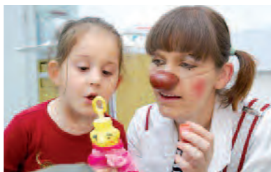
Dr. Olga bei einer Seifenblasentherapie

Gleich zwei Krankenhäuser können sich über zusätzliche Clowndoktoren-Visiten freuen: die Prinzessin Margaret-Kinderklinik in Darmstadt, die seit Oktober an einem zweiten Tag besucht wird, und die Uniklinik Frankfurt, in der nun noch ein dringend notwendiger dritter Besuchstag für die kranken Kinder eingeführt wurde.